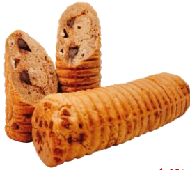
ちょころーる (復刻) 600円 (小麦・卵・落花生・乳含む)