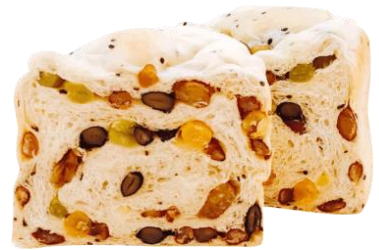
まめ 750円 (小麦・乳含む)