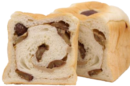
くり 850円 (小麦・乳・卵含む)