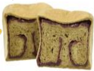
加賀棒茶 600円 (小麦・乳含む)