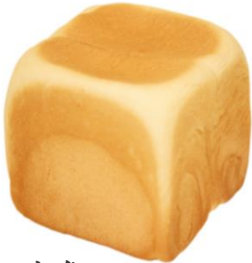
牛乳 500円 (小麦・乳・卵含む)