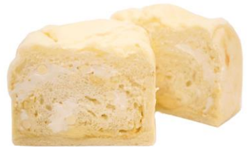
白 (期間限定) 800円 (小麦・卵・乳含む)