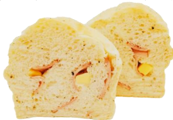
ハム 750円 (小麦・乳・卵含む)