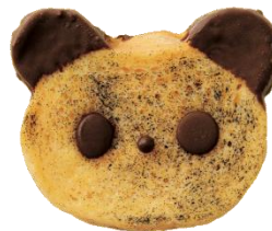
シンデパンダ486円 (小麦・乳・卵含む) パンガパン様との コラボ商品。冷やして 美味しいフレンチトースト。 しっとり濃厚なとろける 味わいです。

※アレルギーは特定原材料7品目のみ表示しています。 ※写真はイメージです。実際の出来上がり具合が多少異なる場合がございます。