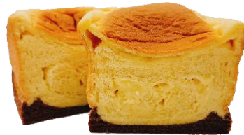
ぷりん食パン (期間限定) 600円 (小麦・乳・卵含む)