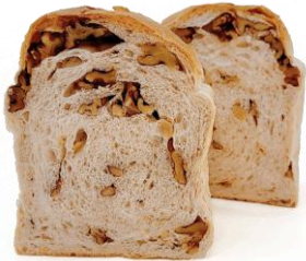
くるみ 700円 (小麦・乳含む)