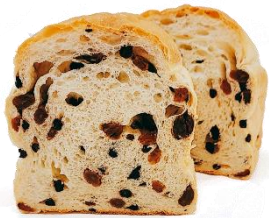
鬼ぶどう 800円 (小麦・乳含む)