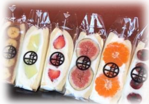
フルーツサンド 550円～ 火・水・金・土・日曜 数量限定販売